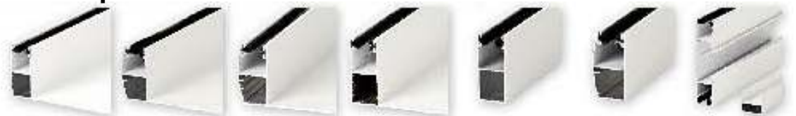
ΦΤΕΡΟ 12 ΦΤΕΡΟ 14 ΦΤΕΡΟ 16 ΦΤΕΡΟ 17 ΚΑΝΑΛΙ ΑΠΛΟΙΣΟ ΚΑΝΑΛΙ ΑΠΛΟ ΟΒΑΛ ΚΑΝΑΛΙ ΔΙΠΛΟ